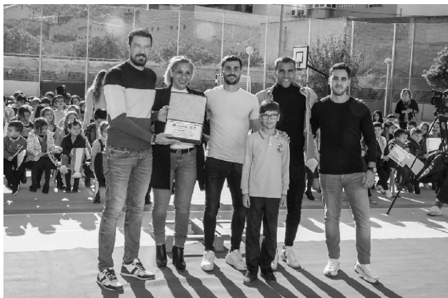
■ Jugadores y Cuerpo Técnico Orihuela C.F.