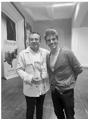
EL Director de la Compañía Nacional de Danza, Joaquín de Luz, apoyando el proyecto de "Danza en la escuela" del Colegio.