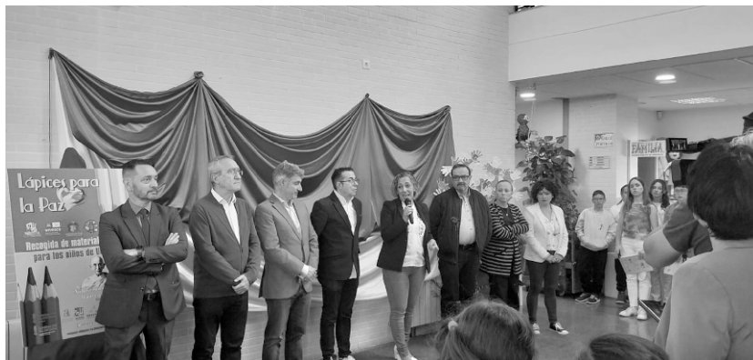
■ Acto de presentación de la campaña.

La Campaña Lápices para la Paz, pretende poner en valor la solidaridad de las personas por medio de la recogida de material escolar; fundamentalmente lápices que representan el símbolo de la concordia entre personas.