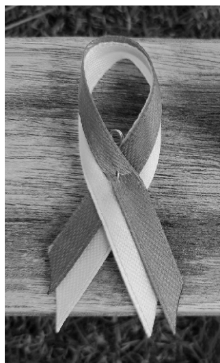
■ Bandera de Ucrania.

de Padres "Gabriel Miró", la Universidad Miguel Hernández, la Cámara de Comercio, la Asociación de Comerciantes de Orihuela y la Cámara de Comercio son colaboradores de esta iniciativa.