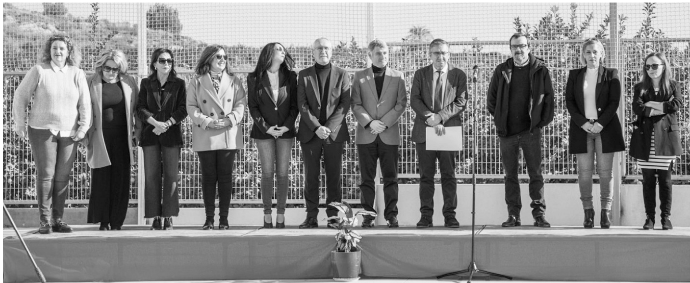
■ Autoridades que presidieron el acto.

EL CONSELLER DE EDUCACIÓN PRESIDE EL ACTO DEL DÍA DE LA CONSTITUCIÓN EN EL COLEGIO PÚBLICO DE HURCHILLO