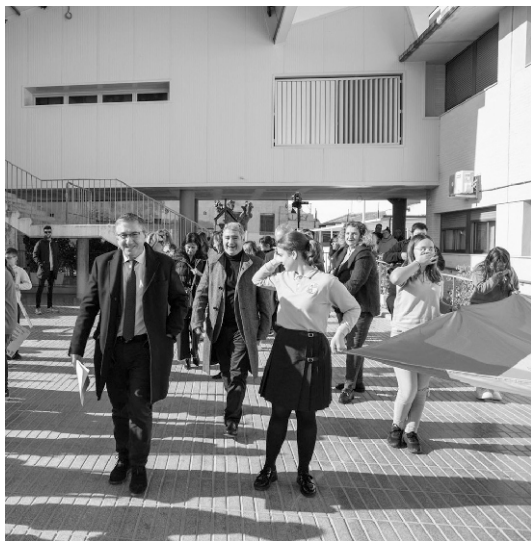
■ El Conseller entrando en el patio.