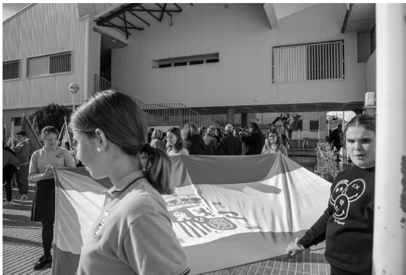
■ Alumnos y alumnas llevando la Bandera de España.