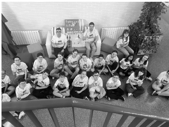
■ Alumnos de sexto, luciendo la camiseta de la campaña.