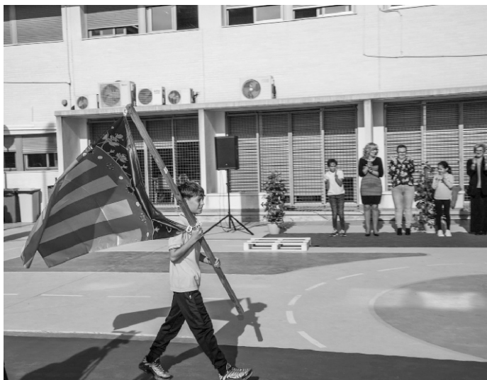
■ Alumno entrando al acto con la Bandera de la Comunidad Valenciana.

Y, por último, el conseller declaraba: “Todo un ejemplo a seguir de trayectoria educativa de este colegio, todo un ejemplo de estos treinta años formando parte de la Red de Escuelas Asociadas a la UNESCO”.