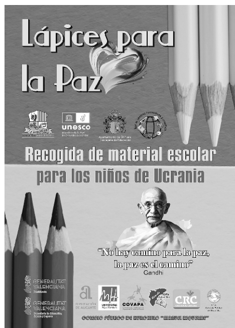
■ Cartel anunciador de la campaña.

EL COLEGIO PÚBLICO DE HURCHILLO PONE EN MARCHA UNA CAMPAÑA DE SOLIDARIDAD CON DE LA RECOGIDA DE LÁPICES