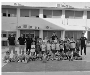
Varios jugadores del Orihuela C.F. visitaron el Centro para promocionar la práctica deportiva fuera de horario escolar.