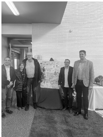
■ Inauguración de las Jornadas a cargo del Director General de Desarrollo Rural de la Conselleria de Agricultura.