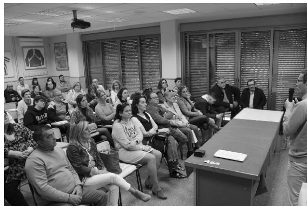
■ Más de 200 personas participaron en las XIV Jornadas de Comida Ecológica.