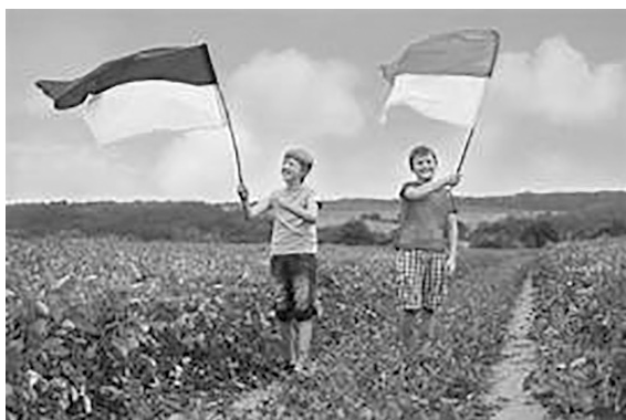
■ Niños con la bandera de Ucrania.

La presidenta de la Confederación Valenciana manifestaba; “Con esta campaña se está dando una sonrisa a muchos niños y niñas de Ucrania que no tienen otra oportunidad para que sean felices”. El inspector de Educación felicitó al Centro por esta iniciativa y animó a colaborar en la misma. El alcalde recalcó: “Con esta iniciativa que se está hoy presentando estáis trabajando para que la paz sea algo lo más pronto posible”.